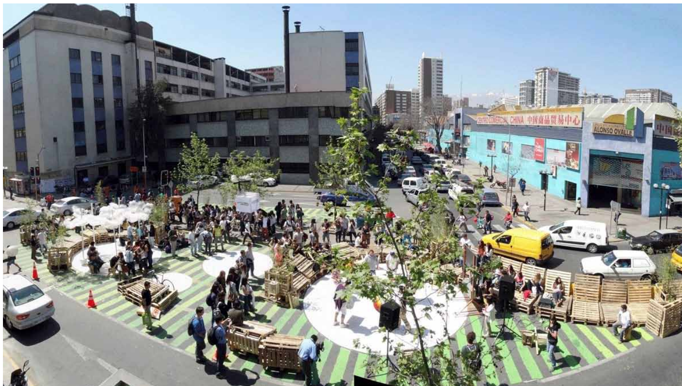
Vietų kūrimo integracija San Diego-Bandera ašyje. SANTIAGO DE CHILE