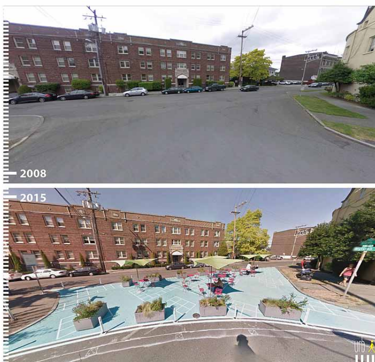
Universiteto gatvė, Sietle, JAV

Taip pat kyla klausimas kas turėtų prisiimti atsakomybę, pavyzdžiui, įvykus nelaimingam atsitikimui vietų kūrimo teritorijoje. Iš vienos pusės, kadangi tai yra viešoji erdvė, galutinė atsakomybė turėtų tekti savivaldybei. Tačiau remiantis vietų kūrimo požiūriu, pagal kurį bendrai sukurtos erdvės priklauso visiems, kyla neaiškumų dėl teisinės atsakomybės apibrėžties.