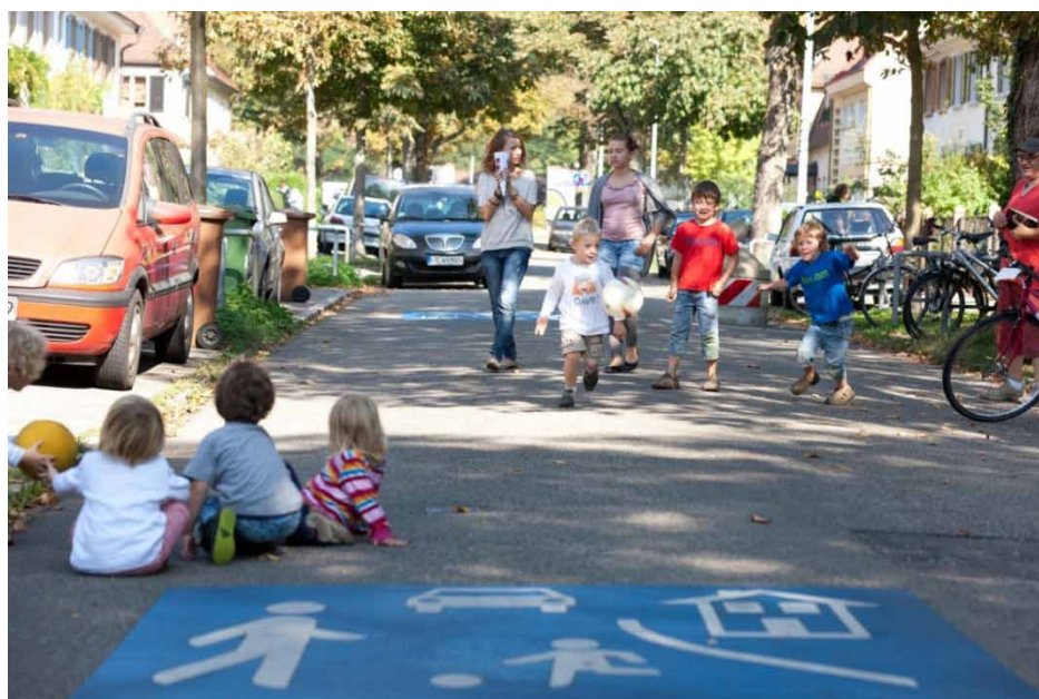
Viena iš daugiau nei 180 „gyvųjų gatvių“ Freiburgo mieste (Vokietija)

„Praeityje šis namų jausmas neapsiribojo vien namu, kuriame buvo gyvenama, tačiau apėmė visą kaimą ar netgi miestą. Vaikams augant, jie ištyrinėdavo apylinkes vis platesniu ratu ir jų „vietos“ supratimas pastoviai plėtėsi. Tačiau moderniam pasaulyje ši erdvė, kurią žmonės vadina savo „namų teritorija,“ smarkiai susitraukė.“ Per paskutinius penkiasdešimt metų miesto planavimas buvo aiškiai orientuotas į motorizuoto transporto eismą, todėl kai kurie rezultatai šiuo metu yra tragiški: baisios ne žmonėms pritaikytos gatvės ir aikštės, sumažėjusi gyvenimo kokybė ir padidėjęs avarijų skaičius, triukšmas ir užterštumas. Europos Sąjunga ne viename politikos dokumente jau pabrėžė šias problemas ir nurodė galimus jų sprendimų būdus. Nors ir negalima sakyti, kad teigiamų padarinių nėra, tačiau beveik visi jie yra miesto centruose. Tuo tarpu, miestų rajonai ir priemiesčiai Europoje vis dar yra smarkiai orientuoti į automobilių eismą ir, būtent todėl, gatvėje žaidžiančių vaikų skaičius yra nedidelis, o socialinis gyvenimas jose – menkas.