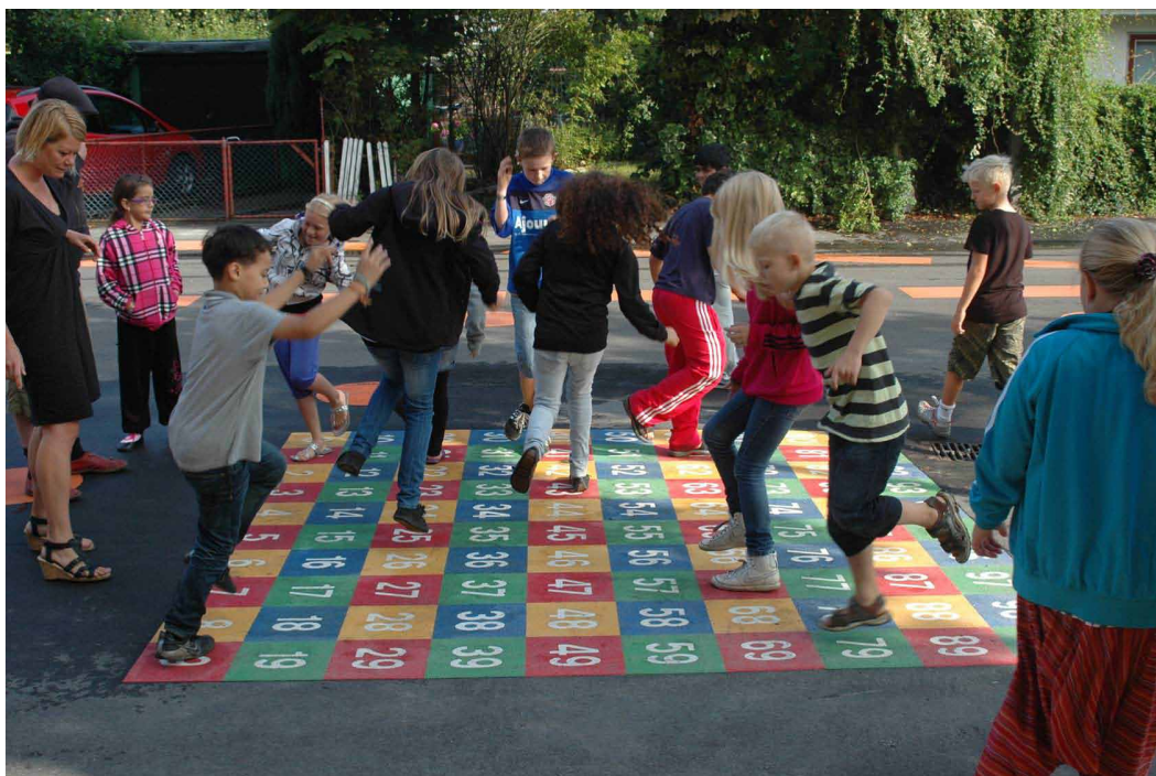
„Gyvoji gatvė“ Gente (Belgijoje) – vasara be automobilio www.leefstraat.be

Roars Vej gatvė buvo pirmą kartą, kuri buvo pertvarkyta į „žaidimų gatvę“ Odensėje. Joje sukurta galimybė vesti fizinio lavinimo pamokas kieme ir žaisti kitus įdomius žaidimus. Pamokų metu gatvėje uždraudžiamas motorizuotas transportas.